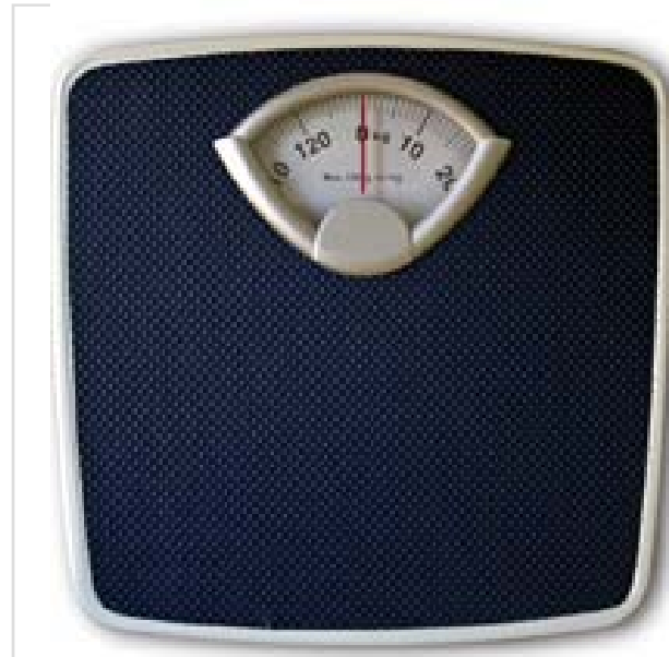
Gli effetti del bendaggio gastrico durano nel tempo (foto Sxc).

«I nostri risultati mostrano che quando si ha un problema importante di obesità esiste una soluzione a lungo termine», spiega Paul O'Brien, autore della ricerca, «ed è questo tipo di intervento. Sicuro ed efficace. Inoltre conferma benefici duraturi, oltre che sulla perdita di peso, anche su altre patologie come il controllo del diabete di tipo 2».